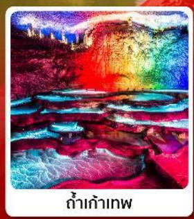
ถ้ำเก้าเทพ