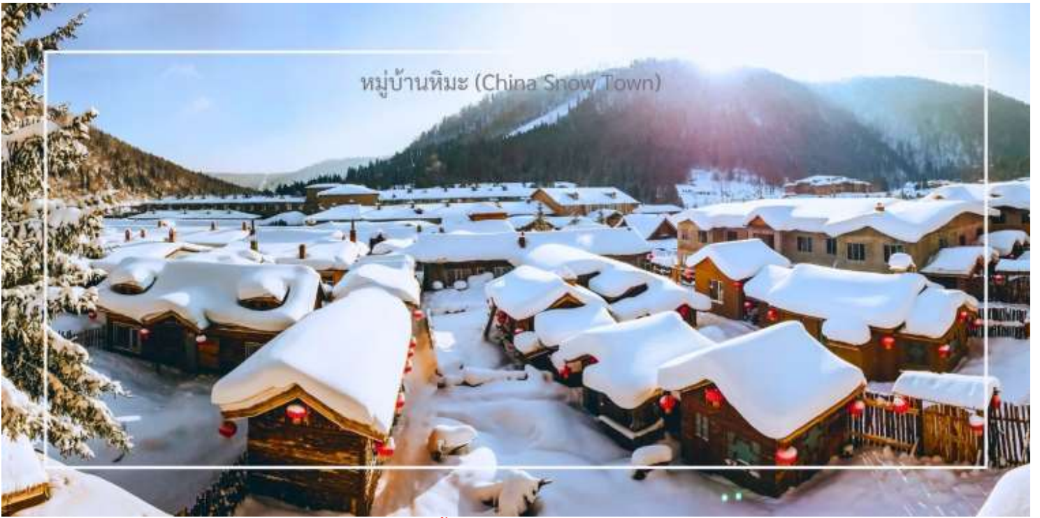
หมู่บ้านหิมะ (China Snow Town)