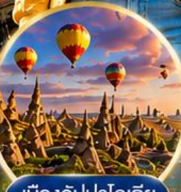
เมืองคปปาโดเกีย Cappadocia