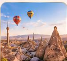
CAPPADOCIA คัปปาโดเกีย