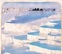
PAMUKKALE ปานุกคาล์