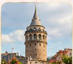
GALATA TOWER หอคอยกาลาตา