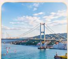
BOSPHORUS STRAIT ช่องแคบบอสฟอรัส