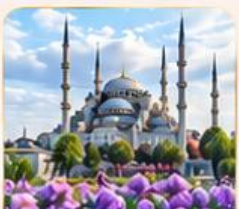
BLUE MOSQUE สุเหร่าสีน้ำเงิน