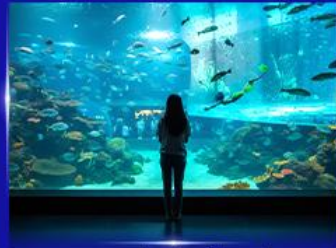
อควาเรียมยักษ์รูปเต่า