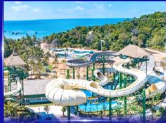
สวนสนุก Sun world Hon thom