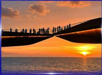
สะพานจูบ Sunset Town