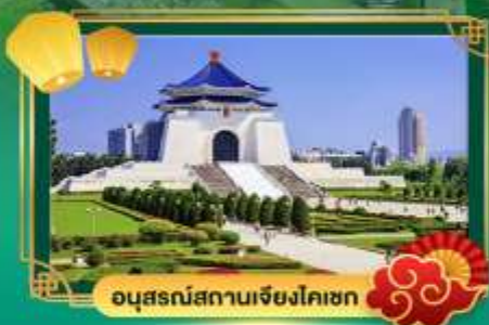
อนุสรณ์สถานเจียงไคเชก