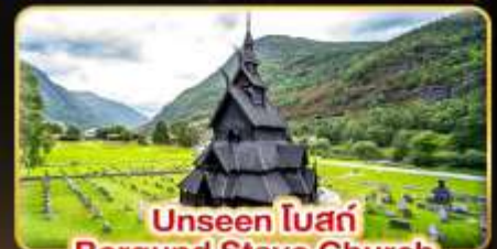
Unseen โบสถ์ Borgund Stave Church